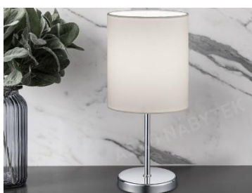
Stolní lampa Jerry, 263 Kč

Přírodní materiály jako dřevo, ratan, bambus nebo látka z lněného vlákna hrají v minimalistickém designu klíčovou roli. Jejich přirozená textura a barevnost dodávají prostoru teplo a příjemnou atmosféru. V ložnici můžete využít dřevěný nábytek, ratanové koše na úschovu, bambusové rohože nebo koberce. Tyto prvky nejenže přinášejí pocit harmonie s přírodou, ale zároveň podporují udržitelný přístup k bydlení.