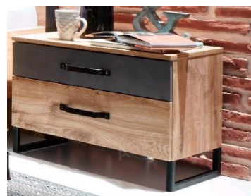
Set nočních stolků Detroit, 5 999 Kč