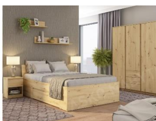
Nábytková sestava Carlos