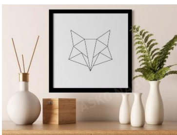
Rámovaný obraz Liška, 319 Kč

Skandinávský design je stále oblíbený pro svou jednoduše a funkčnost. V ložnicích se projevuje prostřednictvím světlých dřevěných podlah, bílých stěn a jednoduchého, ale pohodlného nábytku.