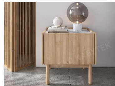
Noční stůlek Boho, 1 999 Kč