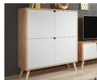
Skříňka 4-dvěřová Tokio, 5 999 Kč