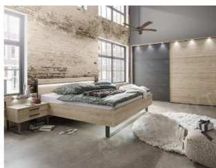
Ložnicová sestava Brüssel