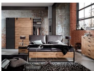
Ložnicová sestava Detroit